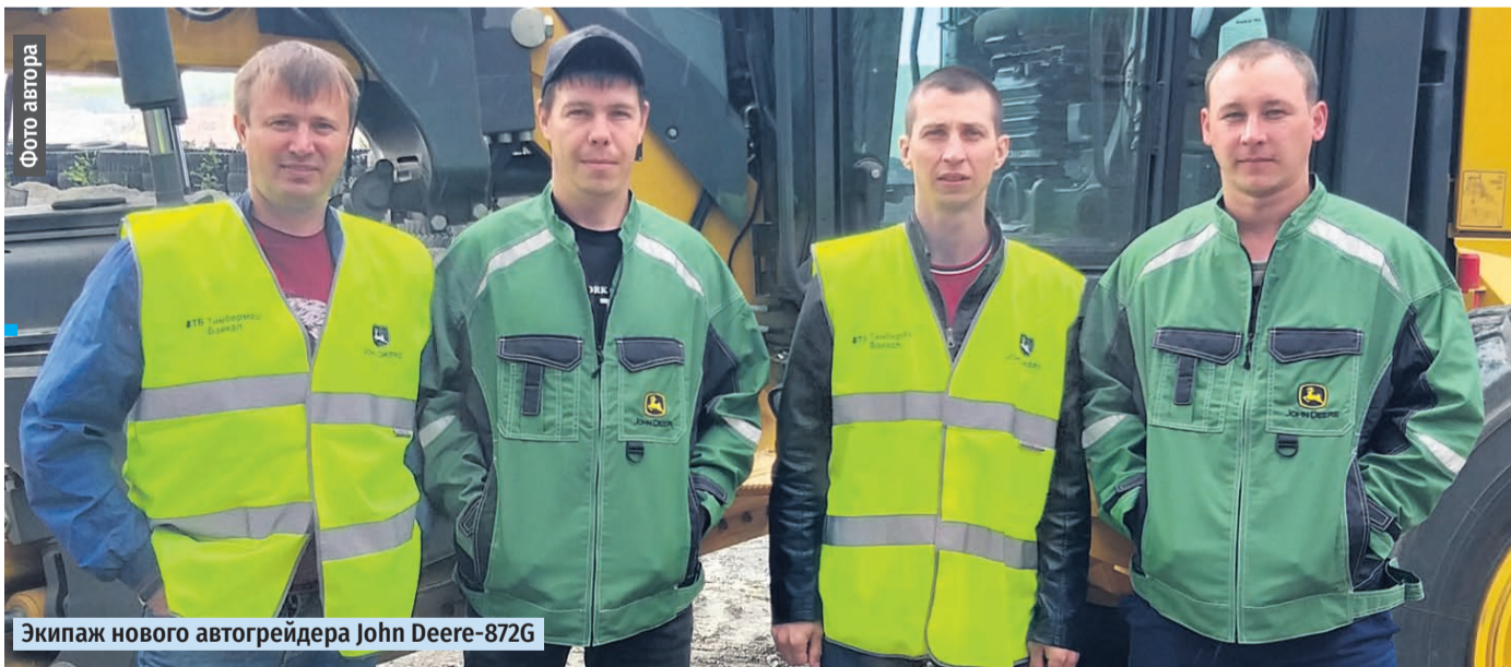
Экипаж нового автогрейдера John Deere-872G