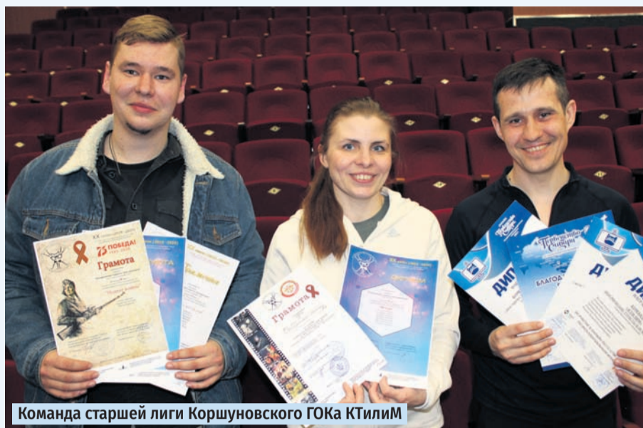
Команда старшей лиги Коршуновского ГОКа КТИЛИМ