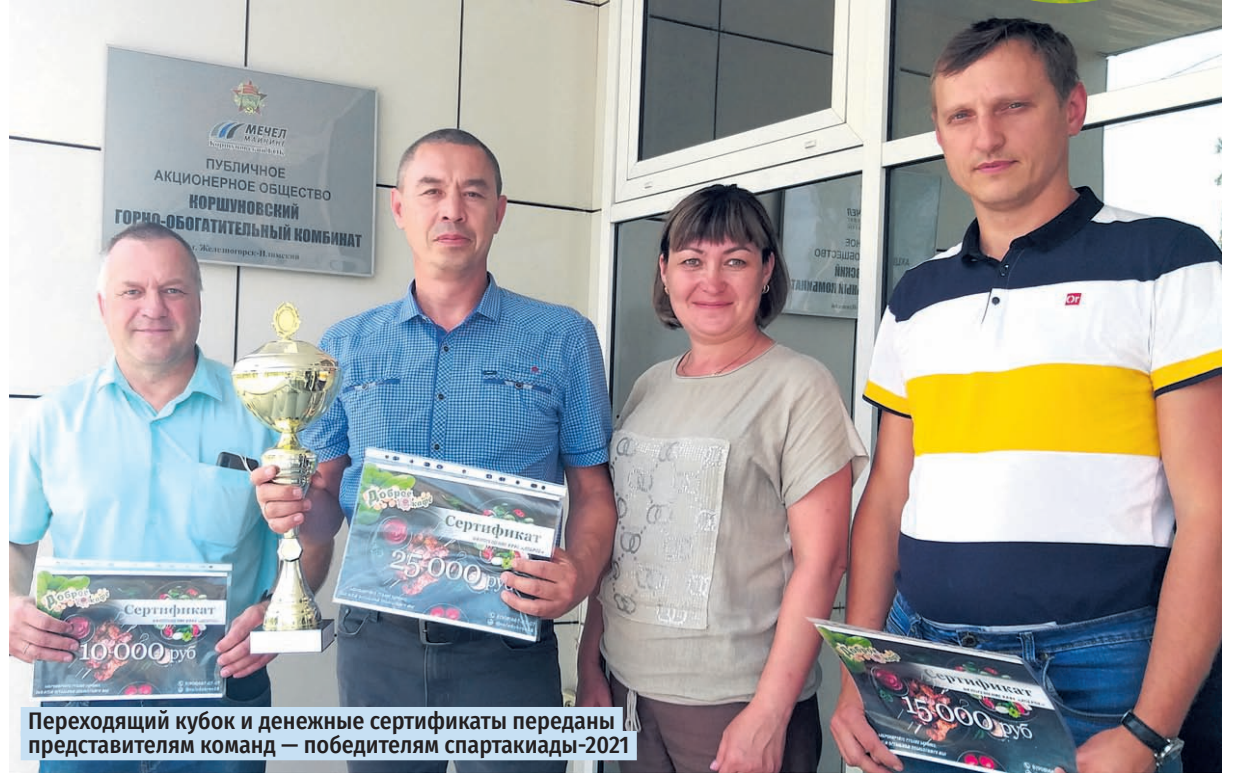
Переходящий кубок и денежные сертификаты переданы представителям команд – победителям спартакиады-2021