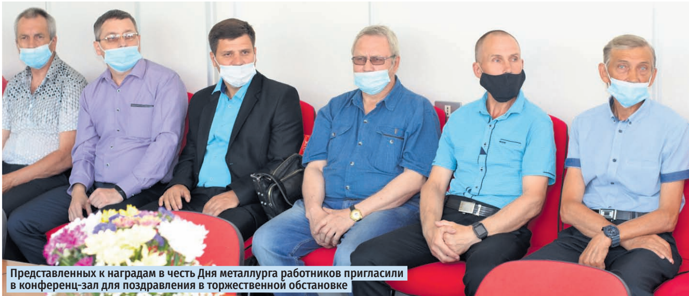
Представленных к наградам в честь Дня металлурга работников пригласили в конференц-зал для поздравления в торжественной обстановке

Руководители Коршунковского ГОКа поздравили работников, представленных к наградам в честь Дня металлурга